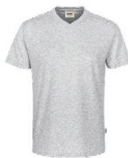
024 ash meliert