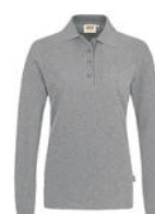
015 grau meliert