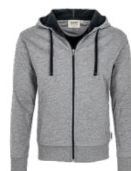
015 grau meliert/tinte