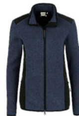
329 marine meliert