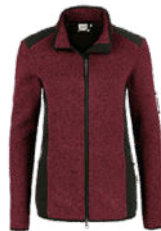
317 weinrot meliert