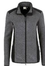
328 anthrazit meliert