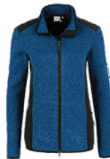
310 royalblau meliert