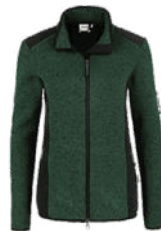
372 tanne meliert