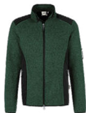
372 tanne meliert