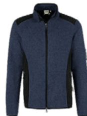
329 marine meliert