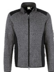
328 anthrazit meliert