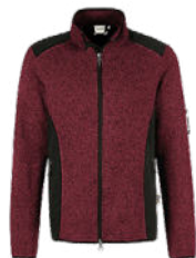
317 weinrot meliert