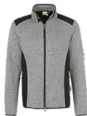
015 grau meliert