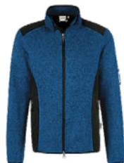
310 royalblau meliert