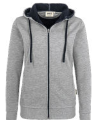
015 grau meliert/tinte